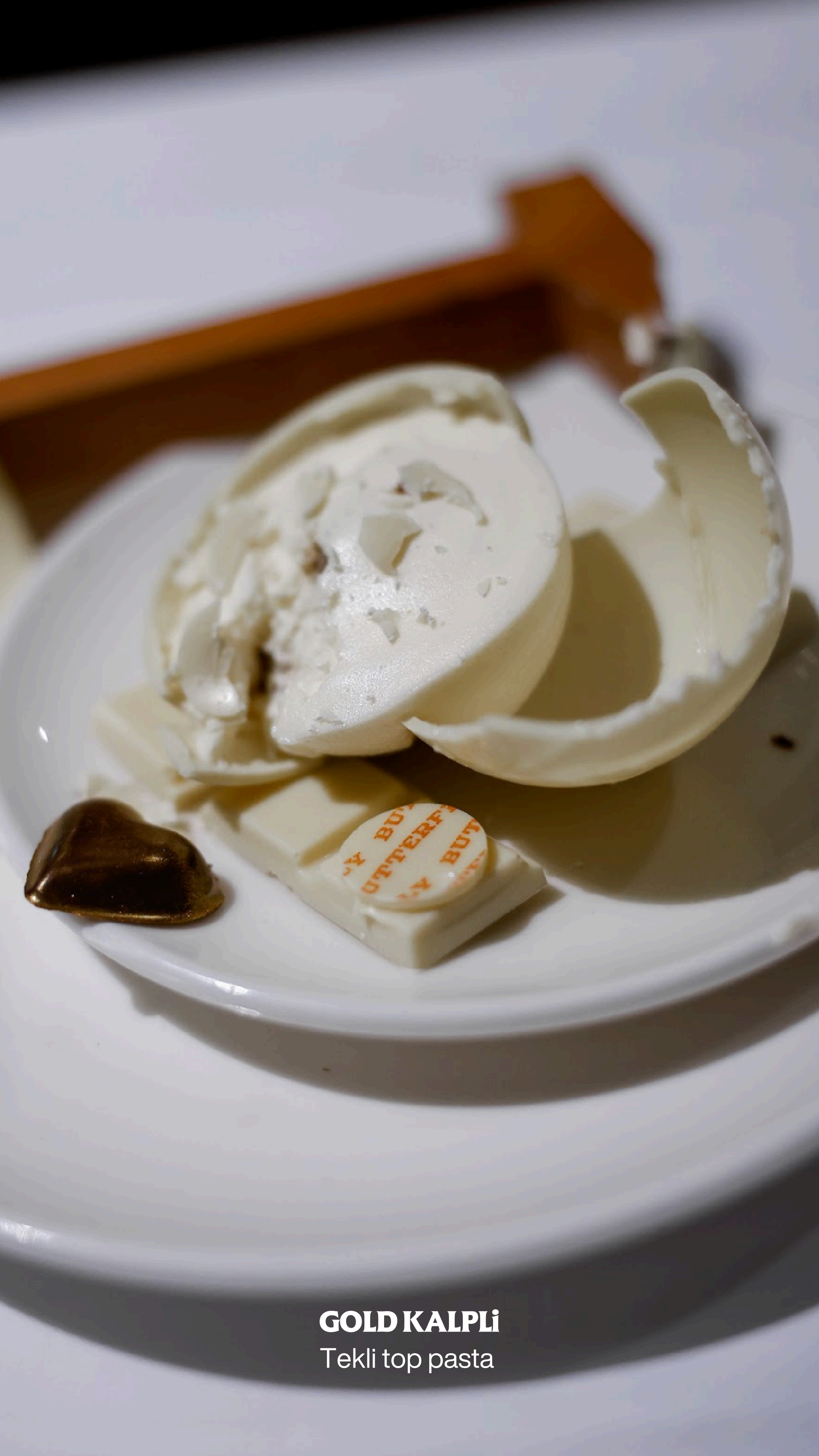
GOLD KALPLI Tekli top pasta