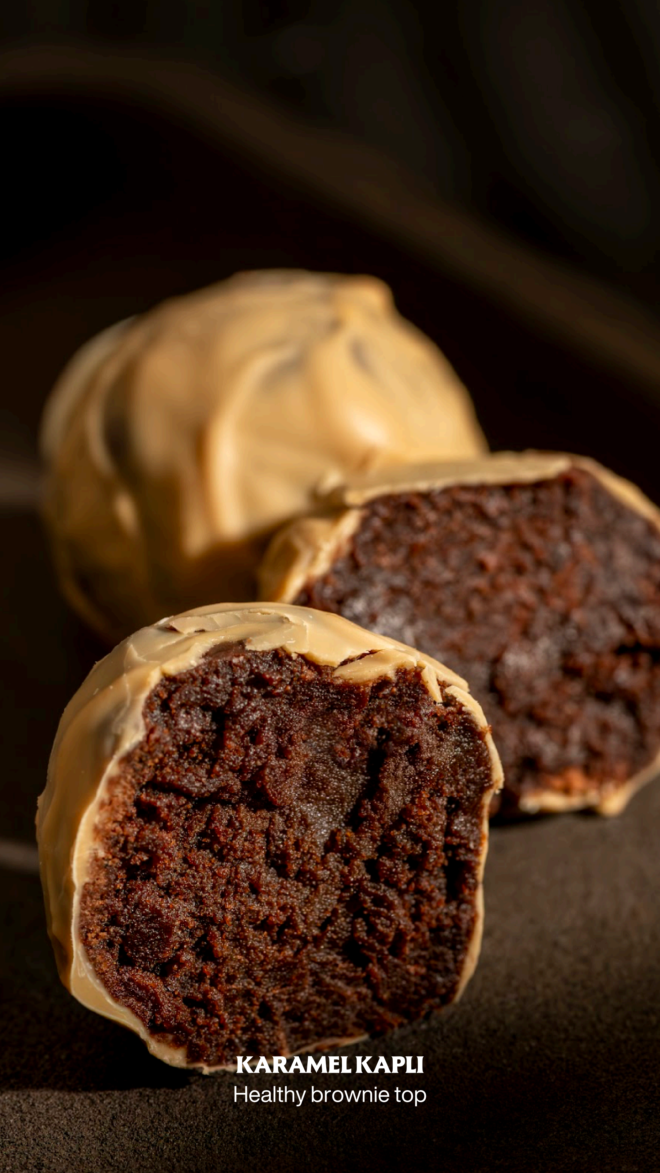
KARAMEL KAPLI Healthy brownie top