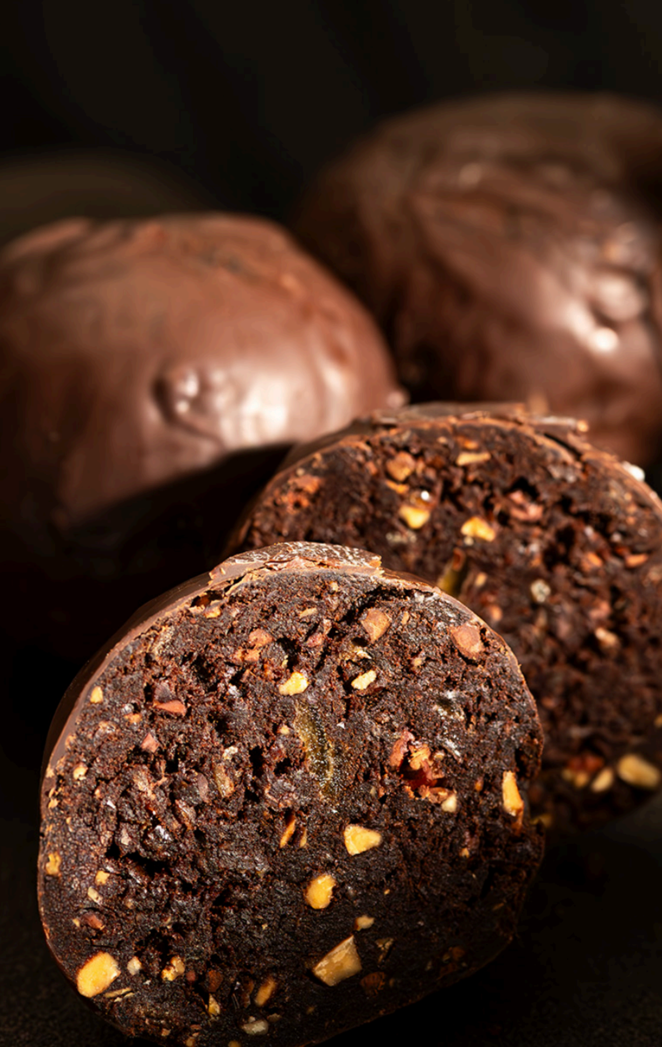
BITTER CİKOLATA KAPLI Healthy brownie top